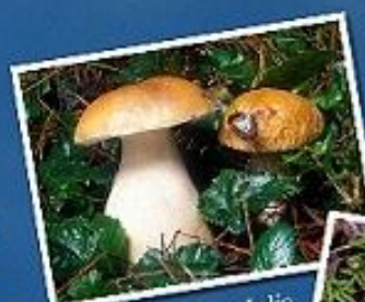
Boletus edulis Boleto