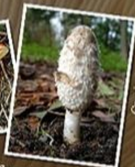
Coprinus comatus Coprino-cabeleto