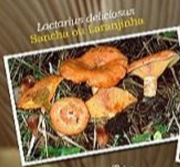
Lactarius deliciosus Sancha ou Laranjeira